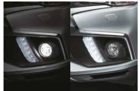
Faros antiniebla / Luces de posición a LED

Decoración cromada en el portón trasero. Nuevas luces direccionales. Cubierta para ocultar el equipaje (interior) y cámara para visión posterior.